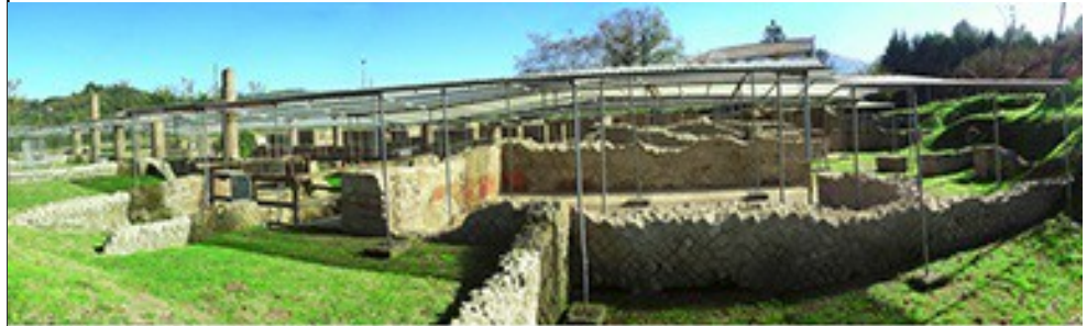
ANTICA ABELLINUM - ATRIPALDA

Dal centro storico è possibile raggiungere facilmente alcuni palazzi gentilizi, il Palazzo della Dogana dei Grani, il Palazzo Caracciolo (1600-1700) e i ruderi del Castello Truppualdo, e l'antica Abellinum ovvero una vasta area archeologica, solo in parte portata alla luce, posizionata sull'altra sponda del fiume Sabato, di recente alla collettività dopo un contenzioso decennale con la proprietà.